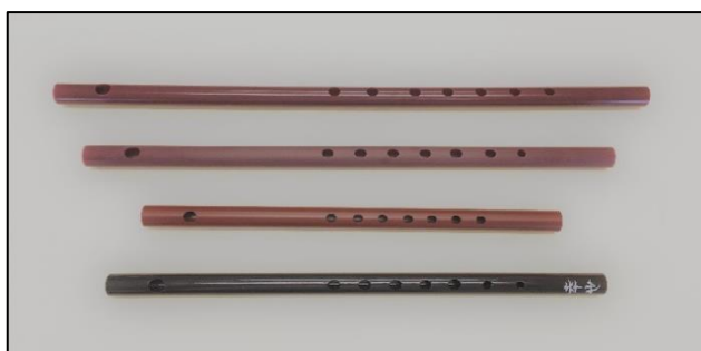
プラスチック製篠笛