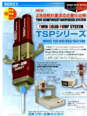
2液 ディスペンサー