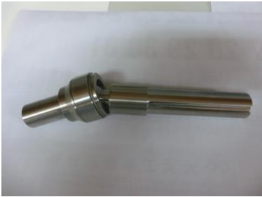
ジョイント(食品用)