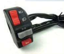
ミニタイプ集合スイッチ