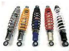
荒巻スリアショック