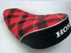
カスタムオーダーシート