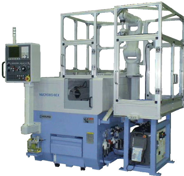
機ロボ一体無人化セルシステム NUCROBO-8EX【ロボハチ】