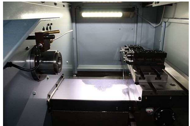
ツーリングはNUCBOY-8と同じ