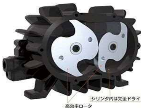
オイルフリーブロワの高効率ロータ