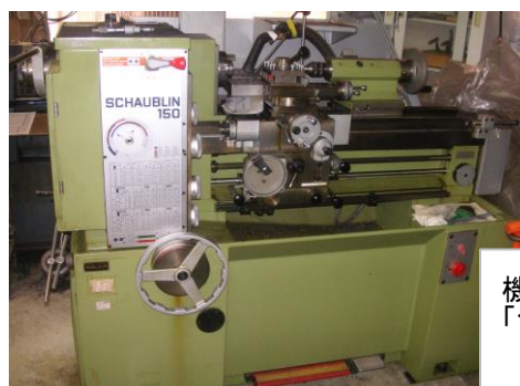
機械設備 「シャブリン 小型精密旋盤」