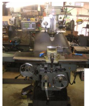
機械設備 「静岡 小型治具フライス盤」