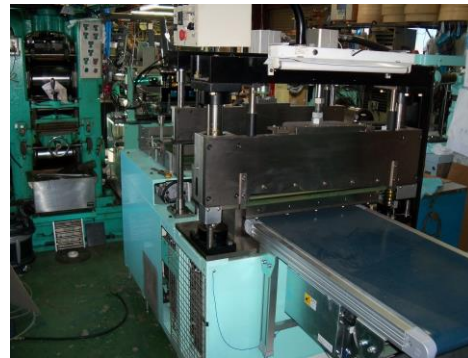
600mm幅対応シャーリング装置