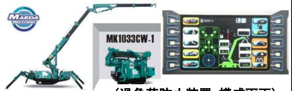
(過負荷防止装置_構成画面)