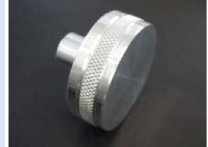
飛び越し割り出し