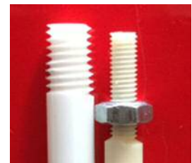
上の写真: セラミックスのネジ切り 超硬のネジ切りも可能