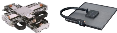
リニアモータシステム、平面リニアモータ