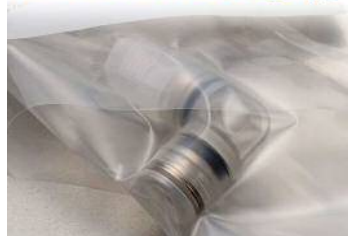
チューブフィッティングPPタイプ