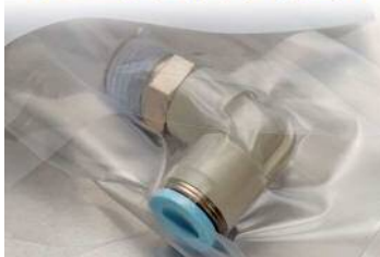
チューブフィッティング