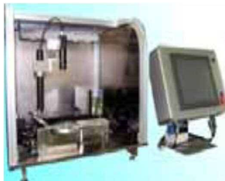
マイクロパーツソーター