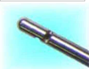
クレンジングニードル