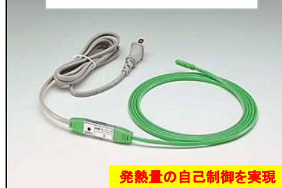
水道凍結防止ヒータ