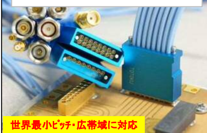
高周波対応ケーブルアセンブリ