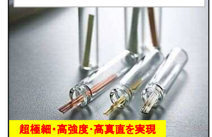
高真直ばね線 サスペンションワイヤ