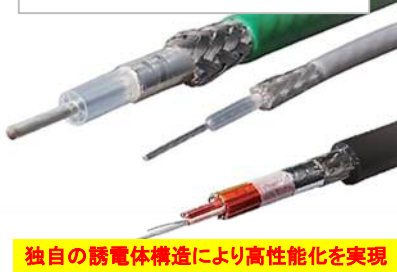
大容量データ伝送ケーブル