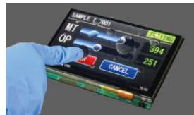
ディスプレイ(TFT液晶)