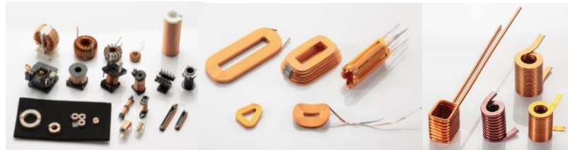
モーター・センサー等のコイル加工品