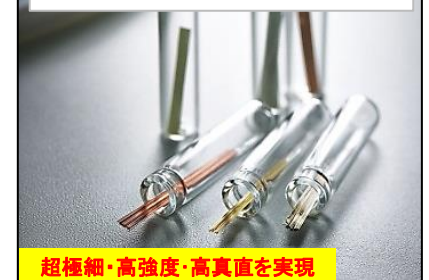
高真直ばね線 サスペンションワイヤ