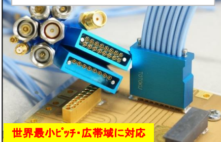
高周波対応ケーブルアセンブリ