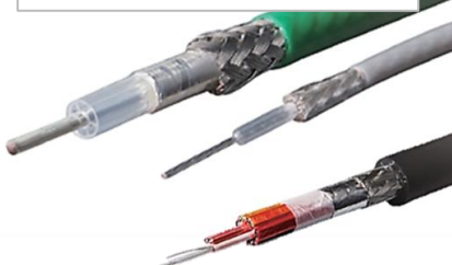
大容量データ伝送ケーブル