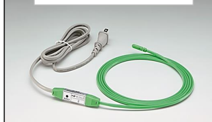
水道凍結防止ヒータ