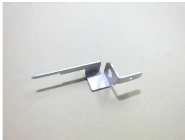
変形しやすい製品をバレル工法で処理