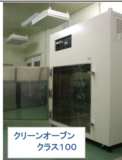
クリーンオープン クラス100