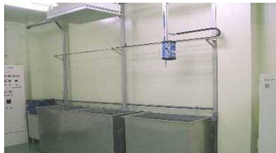
純水超音波洗浄ライン クリーンルーム クラス1000