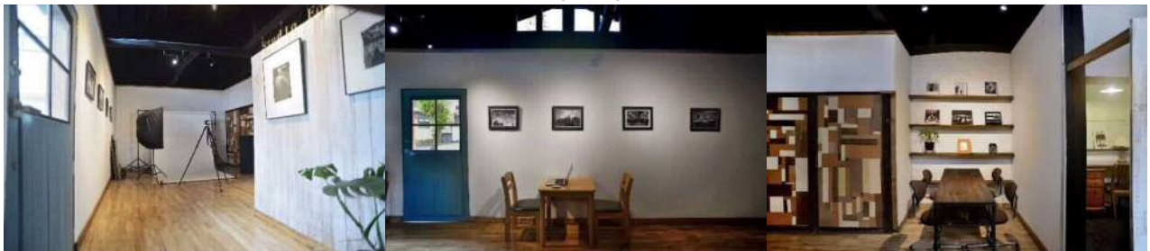
築約100年の古民家をセルフリノベーションした弊社スタジオは、環境に配慮したサステナビリティな第3世代の撮影スタジオです。土壁や梁を生かしたスタジオは古くて新しい弊社独自開発の空間デザインです。2019年7月、下諏訪町にオープンしました！