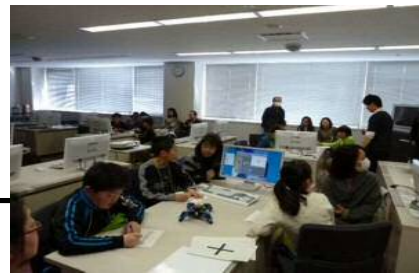
プログラミングを楽しむ子供たち;小中学校特別教室 (岡谷市ものづくりフェア)