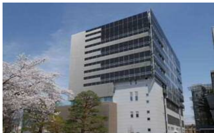
地域資源等を活用した産学連携による国際イノベーション拠点 センターオブイノベーション構想(COI)