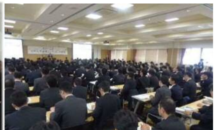
研修を受けた金融機関等の方々企業が企業ニーズと大学シーズのマッチングを加速させていく 連携コーディネータ委嘱制度