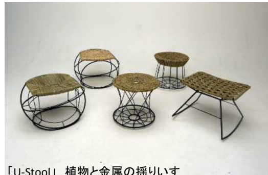
「U-Stool」 植物と金属の揺りいす