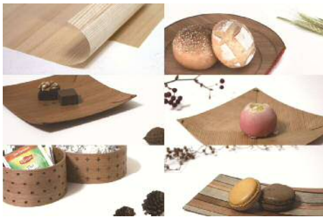
「薄-ki」 木紙によるうつわ