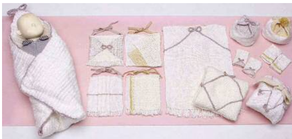
きびそでつくるベビー用品