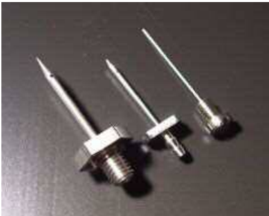
インクジェットプリンター用 ノズル