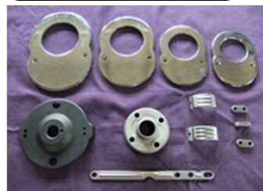
トルクレンチ部品