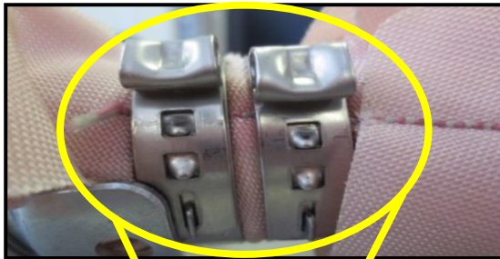
エアバッグ用 ABバンド