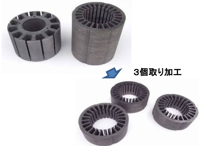
ケイ素鋼板を積層接着し加工