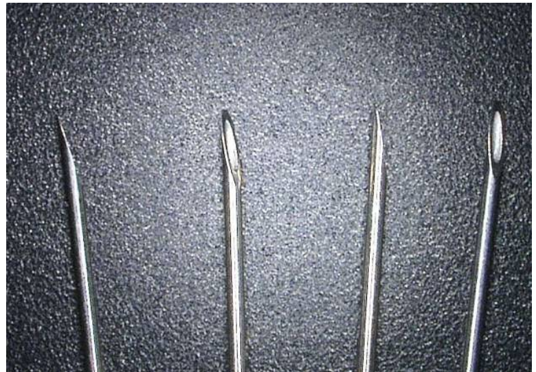
(製品仕様) φ0.46 × ℓ 28.448 材質SUS材