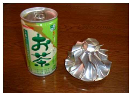
トラック用ターボチャージャー