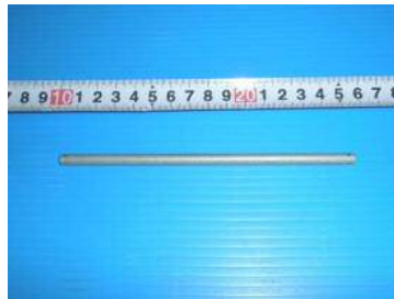
ZAM t=0.8 110t順送丸め加工