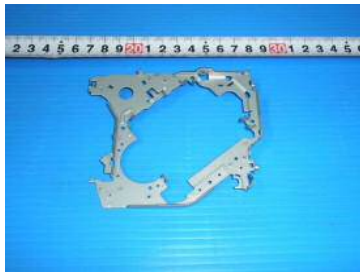
EGC-QF t=1.0 300t順送