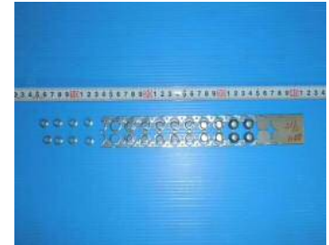
SPCC-SD t=1.2 60t順送 絞り加工