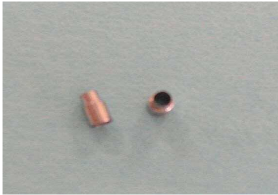
SUS304を使用した医療器具用部品(ステントデリバリー)