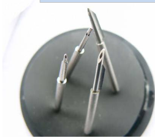
加工例;医療用穿刺針